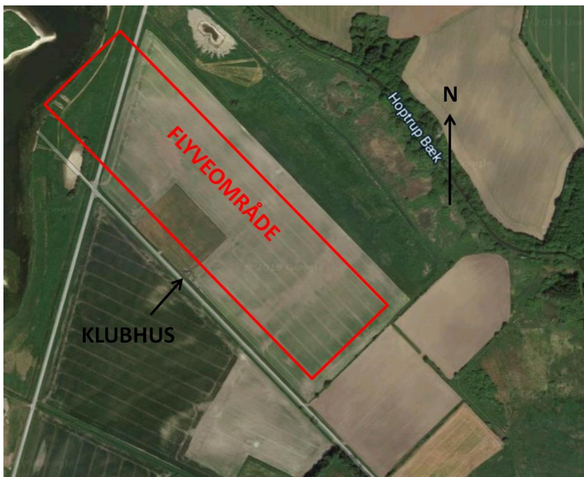
Figur 1. Flyveområde